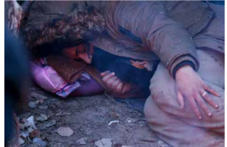
Утро в лагере беженцев