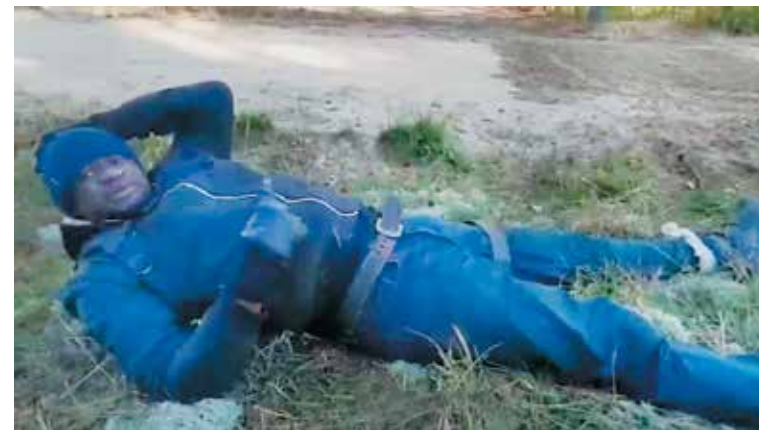
Скриншот сайта Государственного пограничного комитета Республики Беларусь

растеряна и напугана. В спину иностранцам кричали «You must go!» и указывали в сторону Беларуси. Попытка нарушения границы была предотвращена белорусскими пограничниками, которые вовремя прибыли к месту происшествия.