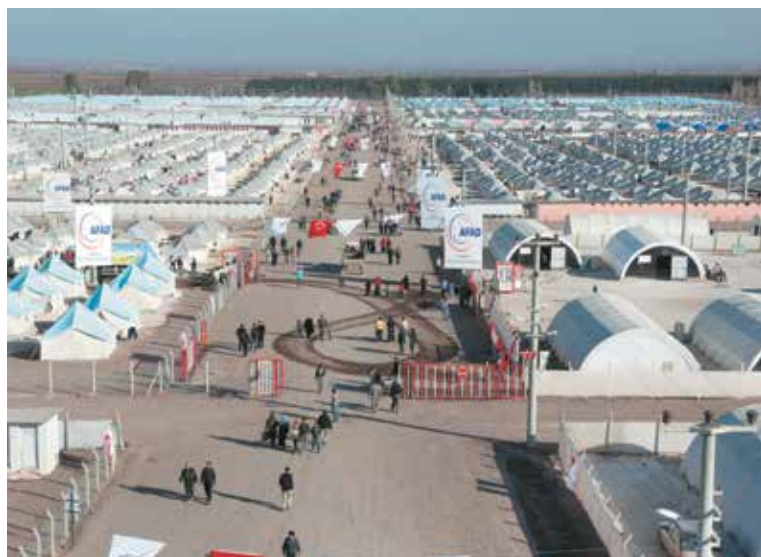
Аккакале Tent City — лагерь для сирийских беженцев в Турции

ветственность перед людьми, чьи мирные жизни они уничтожили. Об этом же сказал и глава внешнеполитического ведомства Ватикана архиепископ Пол Ричард Галлахер, комментируя кризис на белорусско-польской границе: «Мы призываем власти по всей Европе принять на себя ответственность в том, что касается мигрантов и беженцев».