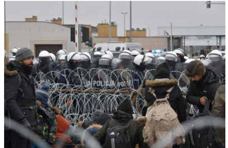
Заграждения на погранпереходе