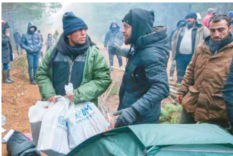
Представители Управления Верховного комиссара ООН по делам беженцев ознакомились с ситуацией в лагере беженцев на границе с Польшей и передали мигрантам небольшую гуманитарную помощь