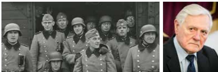
Литовский полицейский батальон