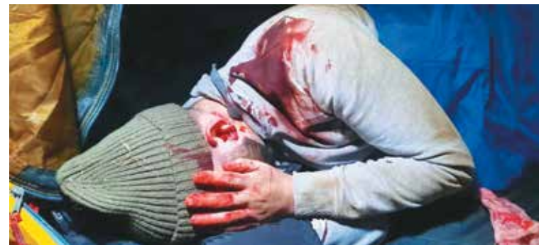
Избитые польскими пограничниками курдские беженцы

9 ноября. Польский автодорожный международный пункт пропуска «Кузница Белостоцкая» (с белорусской стороны — «Брузги») с 9:00 в одностороннем порядке остановил оформление лиц и транспортных средств, следующих через государственную границу. Объективных причин для принятия такого решения белорусская сторона не видит, и при возобновлении работы польского пункта пропуска белорусские службы готовы обеспечить оформление в штатном режиме.