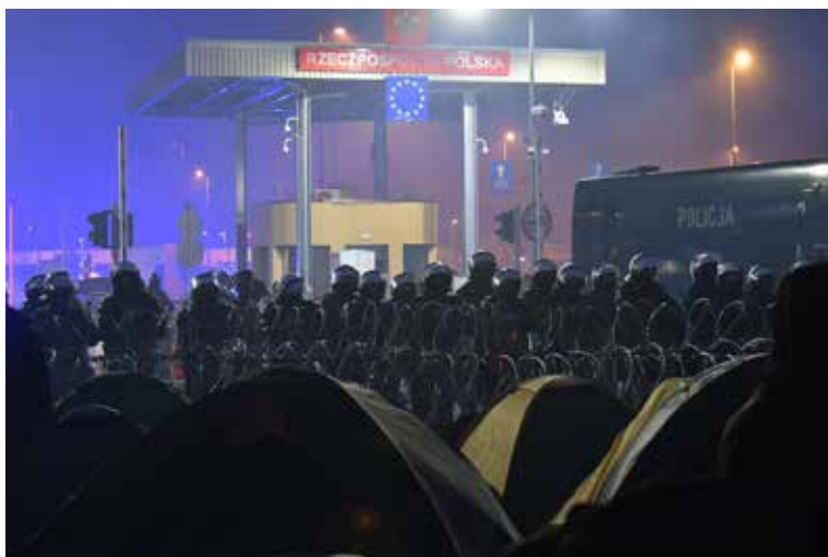
Вечер на погранпереходе

ли семь суток в надежде, что польская сторона выполнит свои обязательства в рамках миграционного законодательства и примет их прошения о предоставлении убежища. Очередную холодную ночь уже на бетоне проведут беженцы в пункте пропуска Брузги. Напротив беженцев у заграждения — вооруженные польские силовики. Пункт пропуска «Кузница Белостокская» сопредельная сторона усилила большим количеством военнослужащих, привлечена также специальная техника, включая водометы. В небе постоянно кружат польские военные вертолеты. Звучат угрозы из громкоговорителей, причем на разных языках. Чтобы согреться, беженцы развернули палатки уже на территории пункта пропуска непосредственно на асфальте и бетоне, разжигают костры в его окрестностях. Выходцы из стран Ближнего Востока продолжают находиться в ожидании гуманитарного коридора для дальнейшего следования в страны Евросоюза. Белорусской стороной ни оружие, ни спецсредства не применялись.