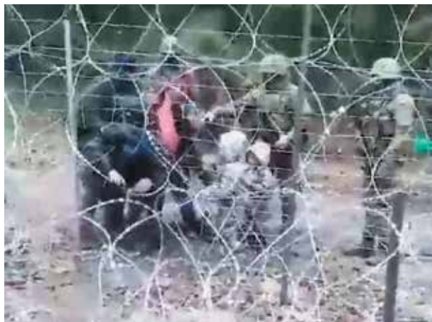
Избитые польскими пограничниками курдские беженцы

сторона польских военнослужащих стало «нормой» в понимании европейских стран. Несмотря на очевидные доказательства бесчеловечных мер, Польша пытается не только скрывать подобные факты от общественности, но и обвинять Беларусь в провокациях на границе, заявляя, что «с белорусской стороны транслируют записи плача и криков детей». Однако обнародованное видео прямо указывает на то, что это не трансляции с территории Беларуси, а результат реальных жестких действий польских правоохранителей на границе.