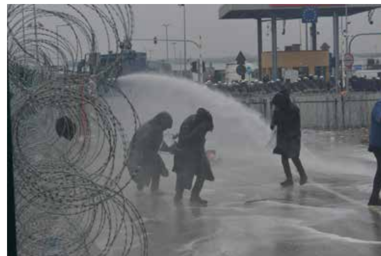
Атака водометов, в том числе с использованием химических веществ, на беженцев (в том числе женщин и детей) и представителей белорусских и зарубежных СМИ