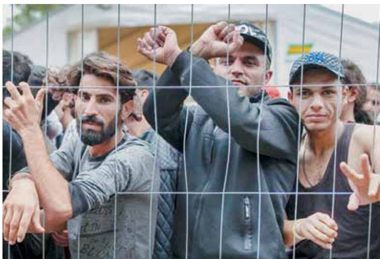
Беженцы в литовском лагере для мигрантов. Похоже, европейская свобода им представлялась вовсе не такой

границ. И с каждым днем все более приобретающие черты нацистских концентрационных. Как следствие, 10 августа на полигоне около деревни Рудининкай, где расположен один из таких лагерей, вспыхнул бунт. Беженцы оказались недовольны условиями своего содержания и попытались вырваться за пределы лагеря. Сделать это удалось как минимум 20 нелегалам.