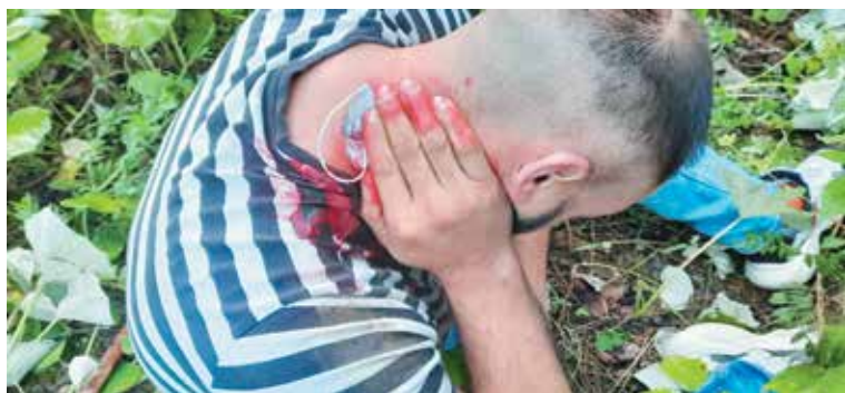
Будни литовской границы. XXI век

10 августа. На участке пограничного поста «Полесье» Сморгонской пограничной группы выявлена очередная группа из десяти человек, в том числе трое детей. Все они были насильно доставлены литовской стороной на линию литовской границы. При этом иностранец из этой группы зафиксировал на видео вопиющий факт: литовские пограничники перемещают беременную женщину без сознания с литовской стороны на линию