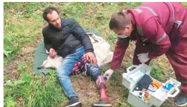
Белорусские медики оказывают помощь беженцам с Ближнего Востока на границе Евросоюза

16 сентября. На участке заставы «Русаки» Гродненской погрангруппы белорусские пограничники увидели свет фар и услышали шум на сопредельной территории. Оперативно прибыв к месту возможного нарушения границы, они обнаружили в заграждении, установленном польской стороной, запутавшегося в колючей проволоке человека. Несмотря на прибытие белорусской погранслужбы и мучения беженца, польские силовики продолжали гнать мужчину на белорусскую территорию через травмирующее заграждение. Оценив происходящее и риск гибели мужчины, белорусская сторона решила оказать неотложную помощь и вызвала бригаду