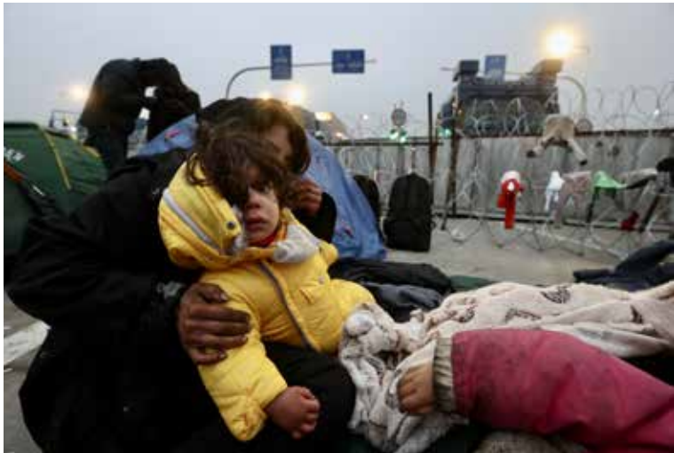
У польского пункта пропуска