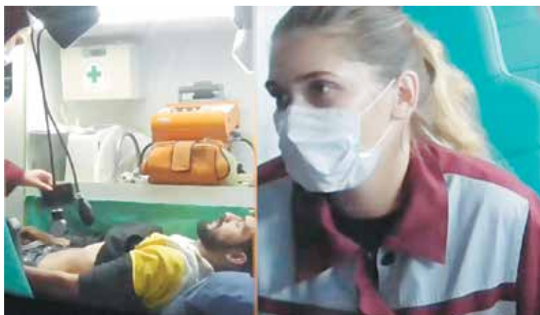
Белорусские медики оказывают помощь беженцам с Ближнего Востока на границе Евросоюза

отправились в разведку, чтобы убедиться в отсутствии со стороны Беларуси пограничных нарядов. После этого польские стражи границы планировали тайно вытеснить очередную группу беженцев в Беларусь. Однако, благодаря действиям белорусских пограничников, данная попытка была пресечена.