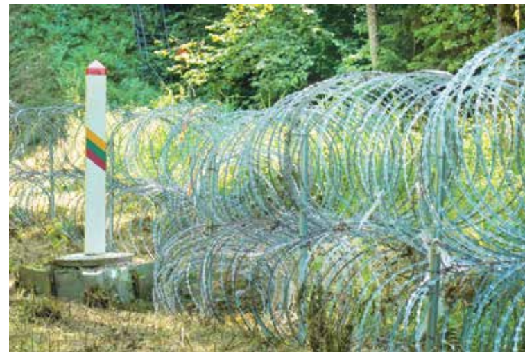
Литва опутывает свою и внешнюю границу ЕС «егазой». Июль 2021 года