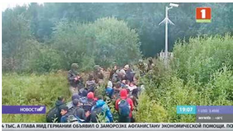
Скриншот телеканала Беларусь 1

17 августа. На участке Лидского пограничного отряда литовские силовики с применением физической силы пытались вытолкнуть беженцев на территорию Республики Беларусь. Среди людей были дети, в том числе грудные, а также беременная женщина.