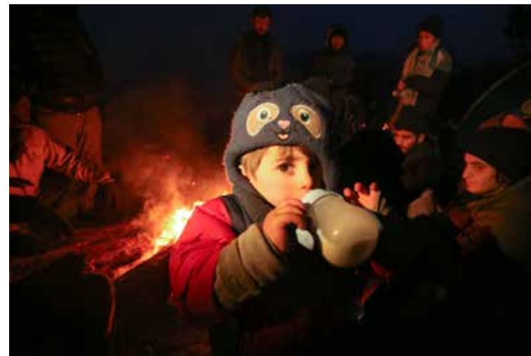
Беженцы готовятся к ночи

15 ноября. К исходу дня более двух тысяч беженцев продолжают находиться в пункте пропуска «Брузги». Все они покинули стихийный лагерь, в котором прове-