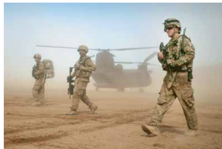
Начало 20-летней войны США в Афганистане, стартовавшей с операции «Несокрушимая свобода», сокрушившей без того истерзанную азиатскую страну