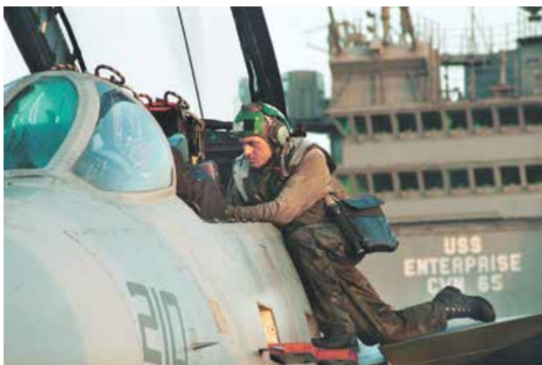
Американское военное присутствие на Ближнем Востоке — предвестник катастрофы. 2001 год