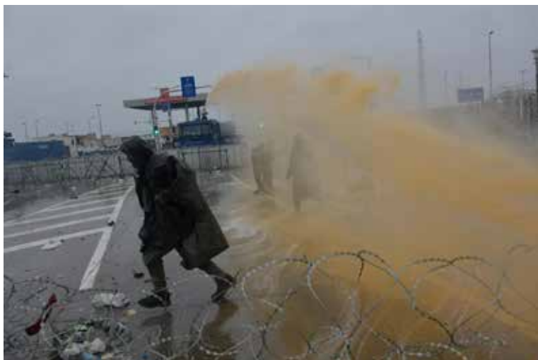
Отчаяние беженцев — и химическая атака со стороны Польши

иначе как насильственные действия в отношении лиц, находящихся на территории другой страны. Белорусская сторона инициирует расследование данного инцидента.