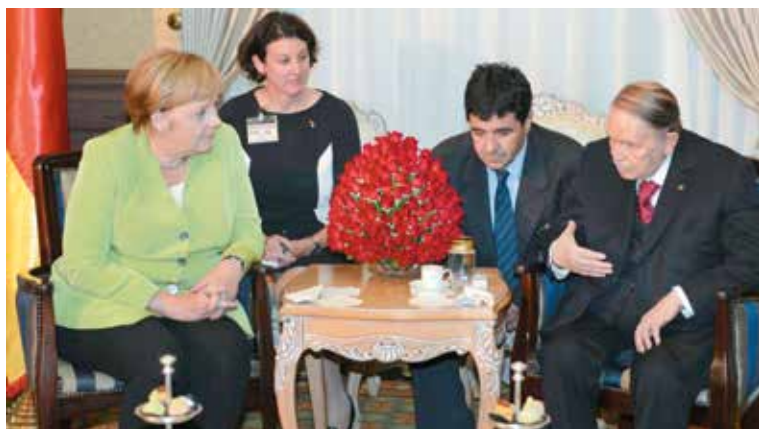
Зеленый свет мигрантам на пути в Германию дает Европа. Переговоры канцлера ФРГ с премьер-министром Алжира. 17 сентября 2018 года

И даже в последний день августа 2021-го Ангела Меркель вновь подтвердила готовность Германии принять беженцев. Об этом зашла речь во время ее пресс-конференции с австрийским коллегой Себастьяном Курцем, писало немецкое издание Spiegel.