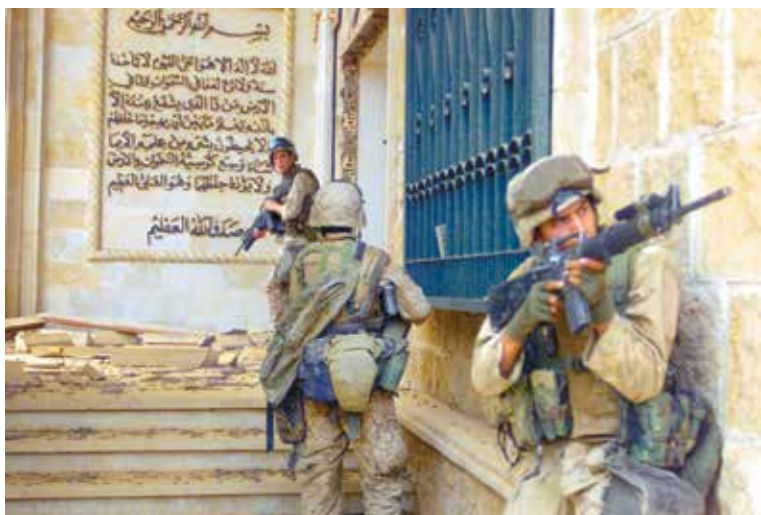
Морские пехотинцы перед входом в один из дворцов Саддама Хусейна. 9 апреля 2003 года