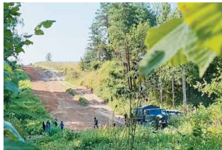
Будни литовской границы. XXI век

14 августа. На участке границы, охраняемом Гродненской погрангруппой, польские стражи доставили иностранца, имеющего телесные повреждения, к линии границы. У мужчины, гражданина Ирака, была сильно рассечена бровь. Не получив помощи от польских силовиков, он обратился к белорусским пограничникам. Те прямо на месте промыли рану и наложили стерильную повязку.