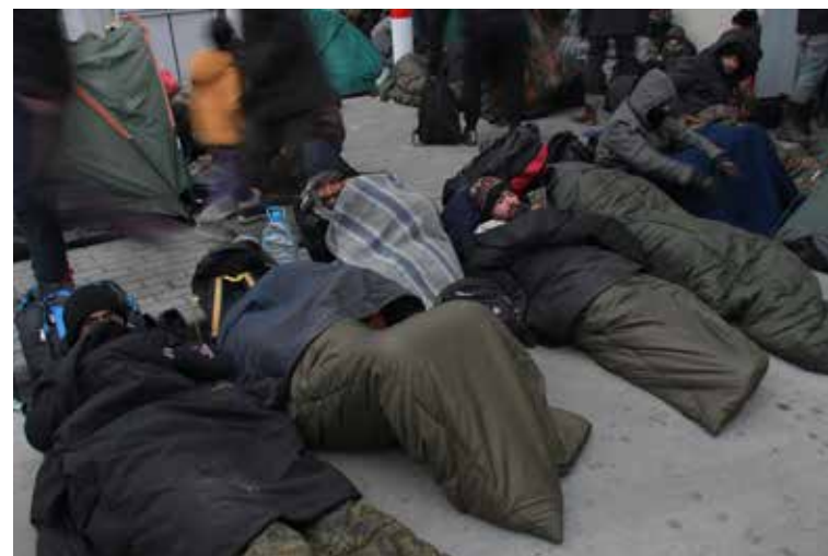
Вечер на погранпереходе